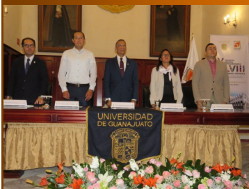
CEREMONIA DE CLAUSURA