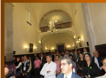
ASISTENTES A LA CLAUSURA