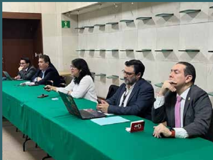
El grupo técnico SEP ANUIES AMOCVIES fue creado en enero de 2019