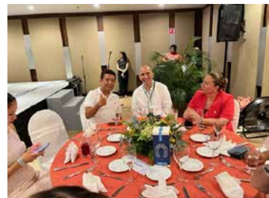
Cena ofrecida a miembros, invitados y funcionarios de la UJAT