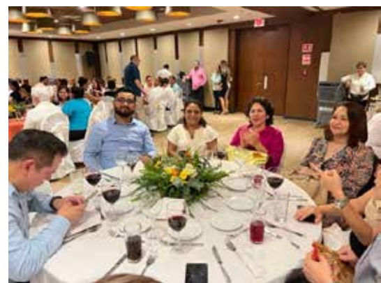
Buen ambiente de convivencia amistosa.