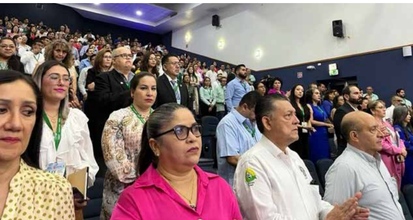
La LIX Asamblea General Ordinaria tuvo 95 participantes, entre miembros asociados, agremiados e invitados.