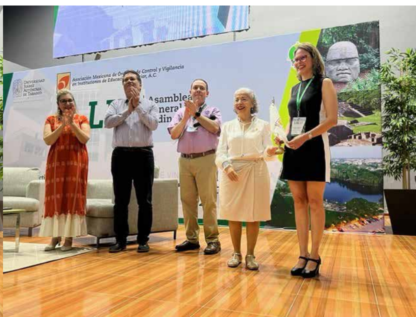
Traspaso del banderín AMOCVIES de la representante de la UJAT a la representante de la UCOL