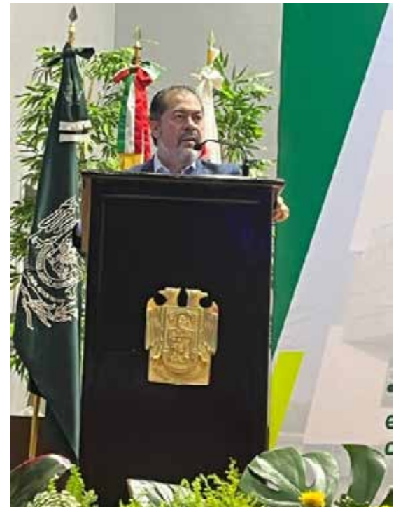
Conferencia del Presidente del Comité de Participación Ciudadana del Sistema Nacional Anticorrupción