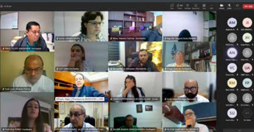
Evento Académico de la Comisión de Control Interno

La Comisión de Control Interno tiene planes de realizar otras actividades académicas sobre el tema del Control Interno universitario.