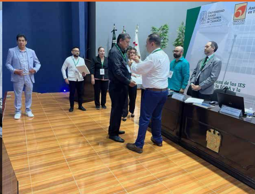
Los nuevos miembros recibieron sus constancias de miembros y un alfiler con el logo de la AMOCVIES, A.C.