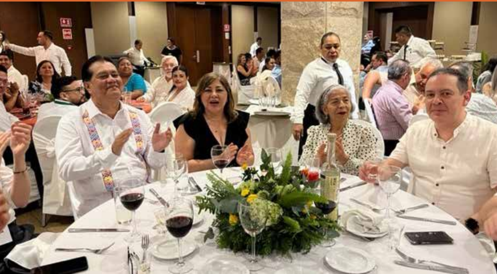
El Rector de la UJAT estuvo en la reunión, junto con su esposa y funcionarios de la universidad.