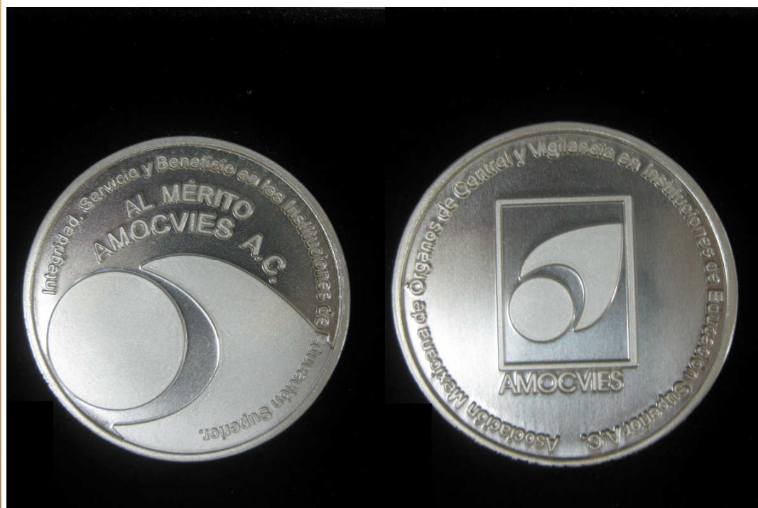
Anverso y reverso de la Medalla al Mérito AMOCVIES, A.C.