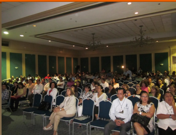
En la foto superior, una vista de la asistencia en las conferencias plenarias del viernes 18, por la mañana, con miembros de ambas asociaciones.

Los asistentes a la XXXVI Asamblea General Ordinaria felicitaron al equipo de colaboradores de la UADY que organizó el evento.