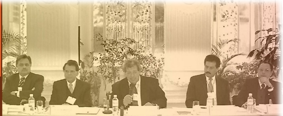
1er Consejo Directivo de la AMOCVIES, AC

Este equipo fundador sentó las bases para el desarrollo y fortalecimiento de los objetivos de la AMOCVIES, destacándose por su liderazgo y visión en la promoción de la transparencia y la mejora continua en las instituciones de educación superior.